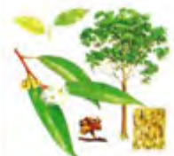
Eucalipto ( Eucalyptus )