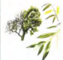
Salgueiro-branco ( Salix betula )