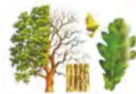
Carvalho comum ( Quercus robur )