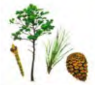
Pinheiro-bravo ( Pinus pinaster )