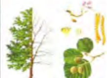
Amieiro ( Ulmus glaberrimus )