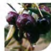
Oliveira (Azeitonas) (Olio de azeitona)