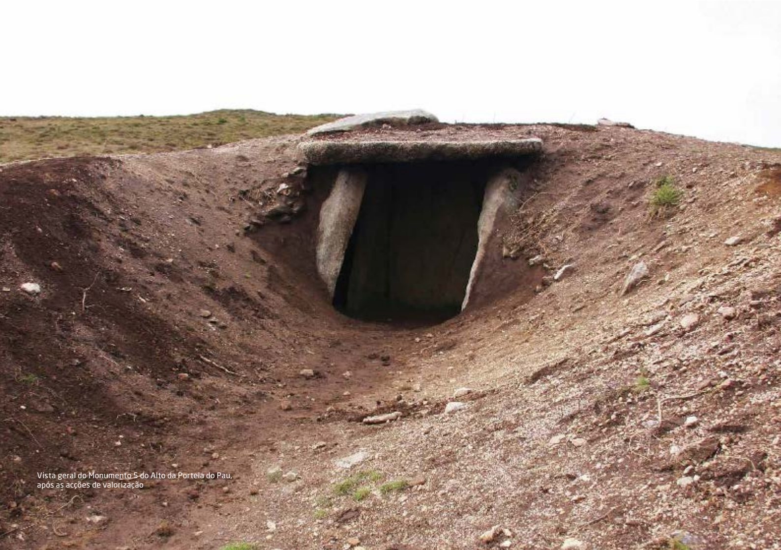
Vista geral do Monumento 5 do Alto da Portela do Pau, após as acções de valorização