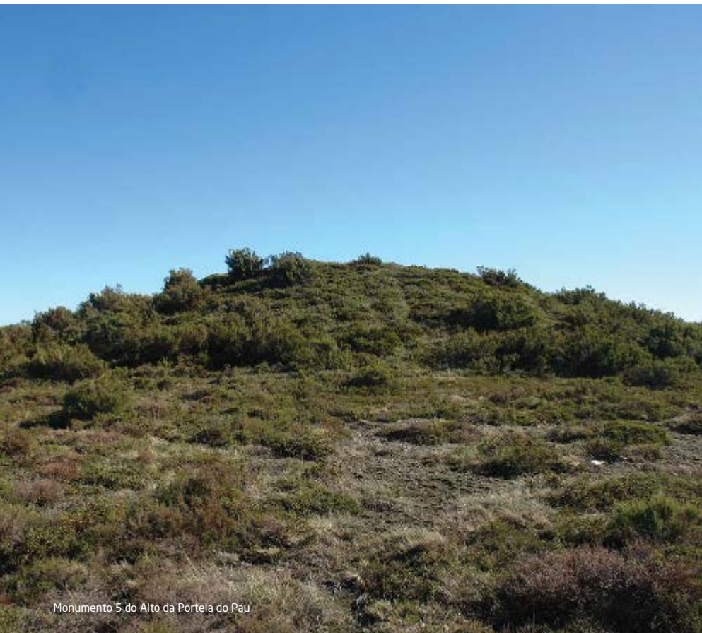
Monumento 5 do Alto da Portela do Pau