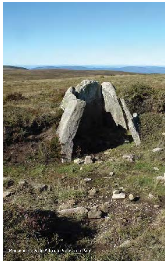
Monumento 5 do Alto da Portela do Pau

Ao olhar da(s) comunidade(s) construtora(s), avistar-se-ia um montículo artificial, de contorno mamilar (mamoá), no qual apenas afloraria a pesada laje de cobertura da câmara funerária. Normalmente, e após um curto período de utilização de algumas dezenas de anos, onde apenas seria depositado um reduzido número de indivíduos, proceder-se-ia ao encerramento da sepultura, sendo esta substituída por uma outra. Em alguns casos, e após largas centenas de anos, poder-se-ia verificar a sua reutilização por outras gentes e novos inumados que nada tinham a ver com os primitivos construtores do monumento.