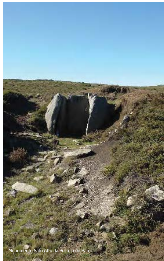
Monumento 5 do Alto da Portela do Pau