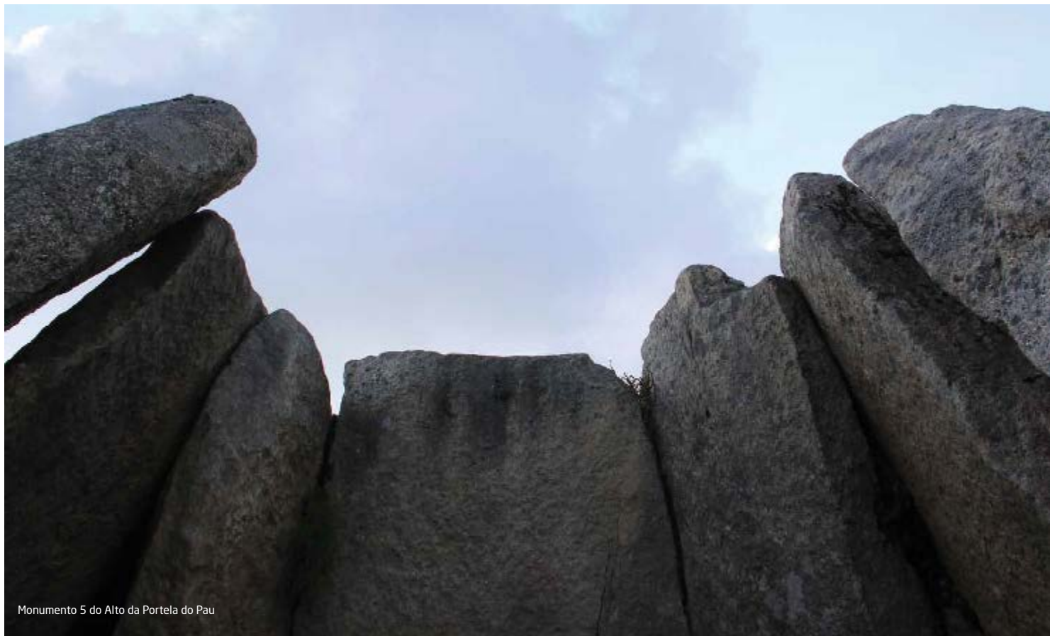
Monumento 5 do Alto da Portela do Pau