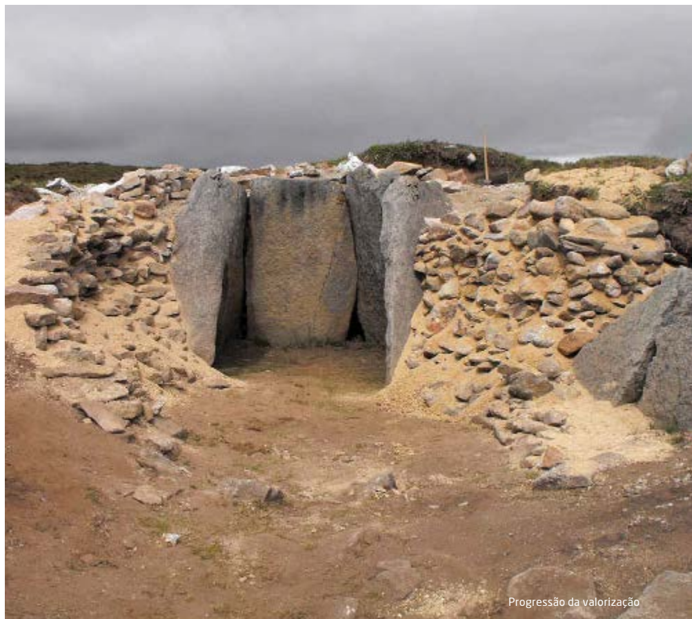
Progressão da valorização