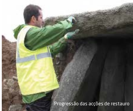
Progressão das acções de restauro