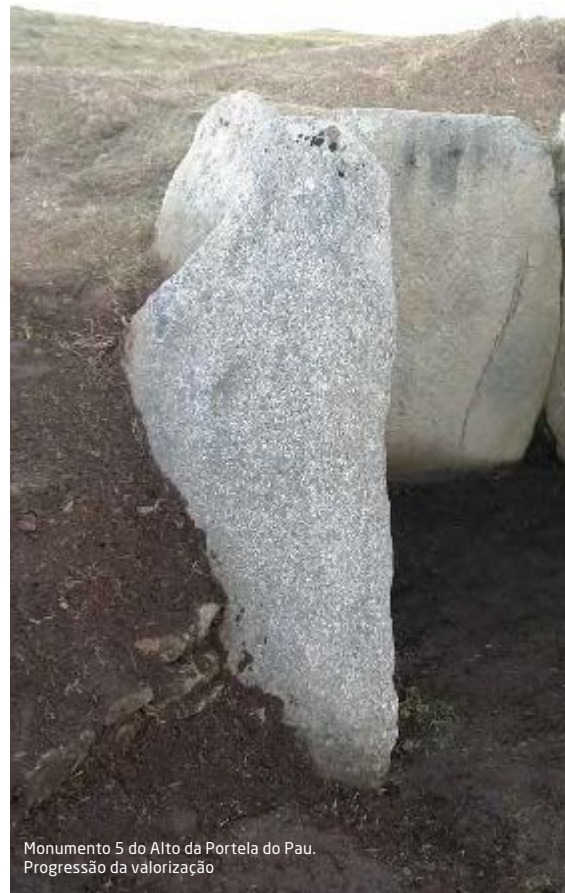
Monumento 5 do Alto da Portela do Pau. Progressão da valorização

Esta impressionante obra arquitectónica era envolta por um enorme volume de terra e pedras que, num momento final, adquiria a forma mamilar. Daí resultando a denominação popular de mamoá. O passar do tempo, a compactidade dos sedimentos, a erosão e a acção humana contribuíram para que este montículo perdesse parte da sua monumentalidade.