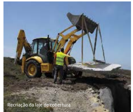
Recriação da laje de cobertura