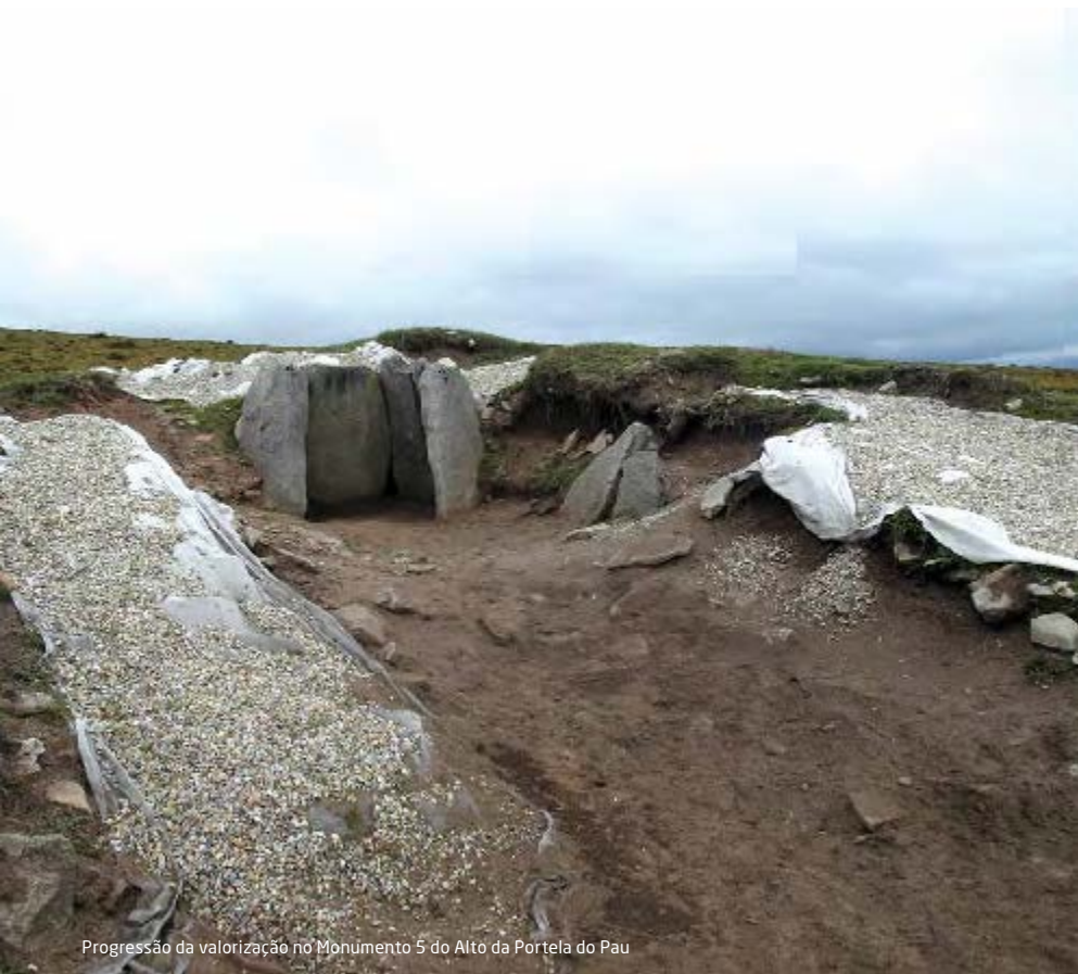
Progressão da valorização no Monumento 5 do Alto da Portela do Pau